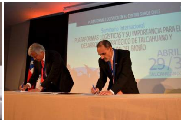
Municipalidad de Talcahuano, Chile