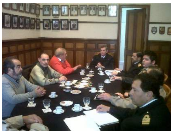
Recuperación de los trenes de carga en Argentina