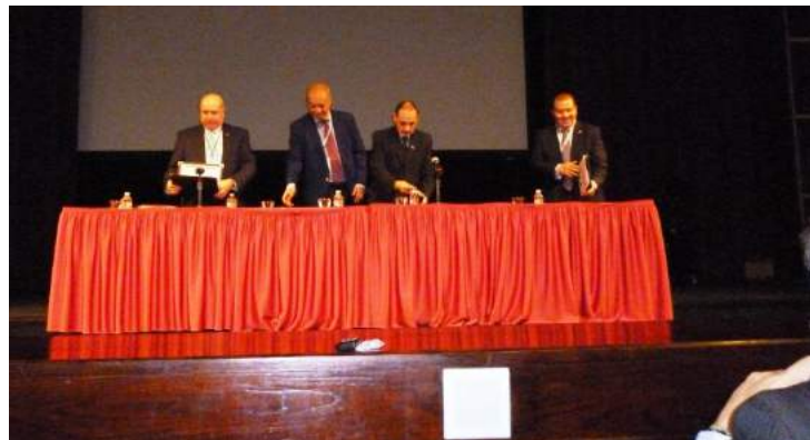
Un de los paneles: NASCO, Zona Franca España, Corredores Bioceánicos de Sudamérica, México, plataformas de Colima