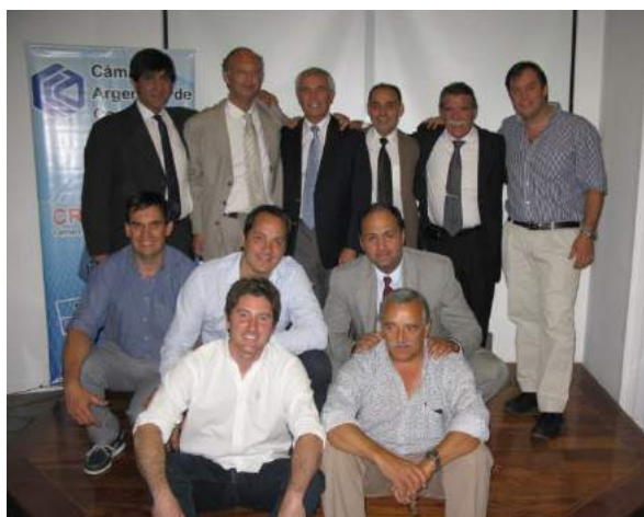
Eventos con Cámaras de Comercio Exterior. Autoridades portuarias. Zona Franca. Industriales.