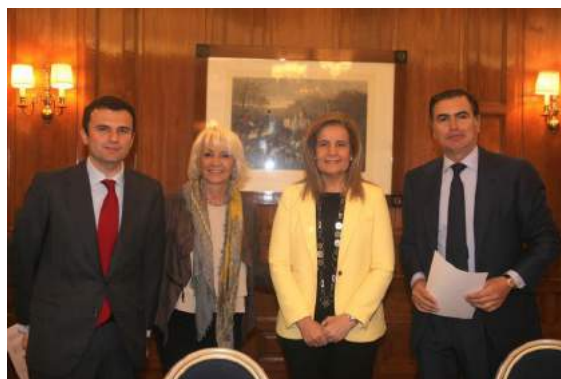
Vicepresidente OMCPL con Alcaldesas de Cádiz y Presidente Cluster Marítimo de España