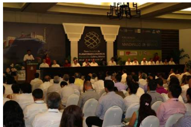
Ceremonia de apertura, autoridades locales y de Gobiernos internacionales