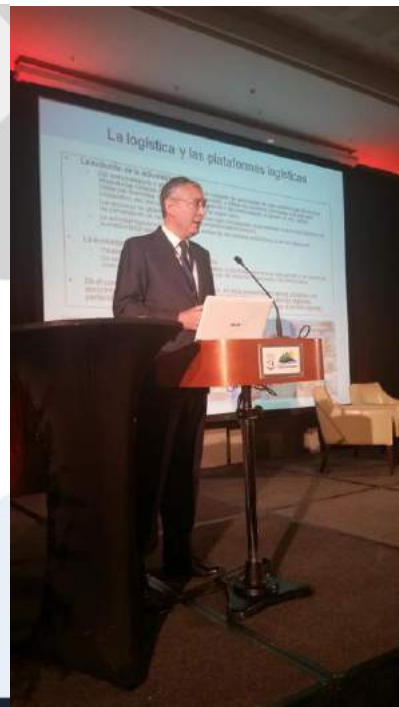
Presentación, Presidente Europlatforms