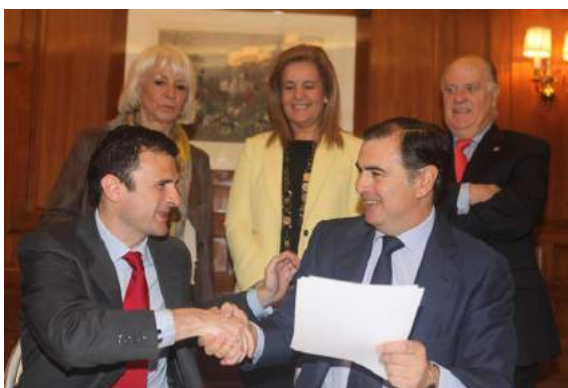
Cluster Marítimo Español