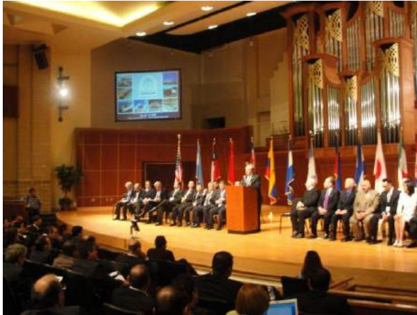
Auditorio, acto inaugural