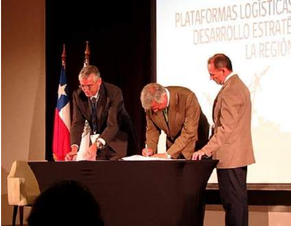
Asociación de Plataformas de Europa