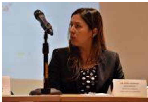
Director Invest Bogota