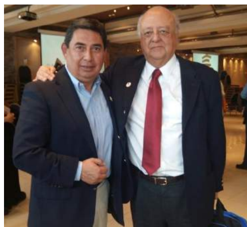
Director OM CPL con Embajador de Chile en Argentina