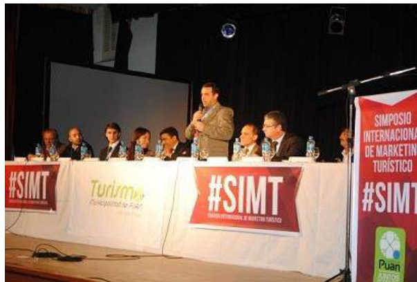
Apertura del Alcalde de Puán