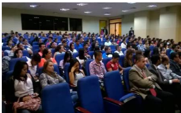
Auditorio Universidad de San Gregorio, Ecuador