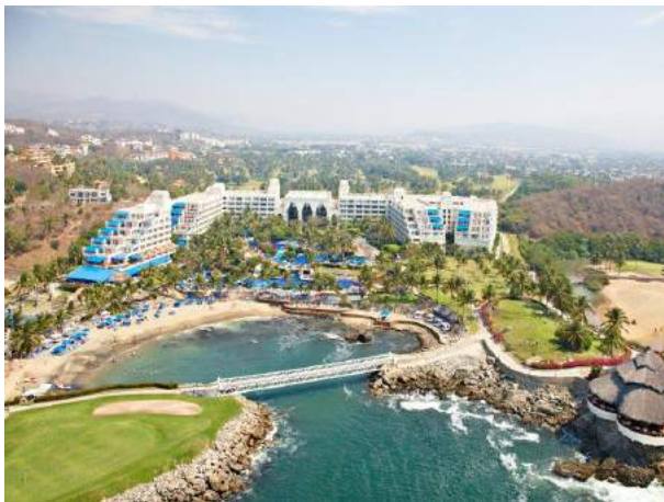
Lugar del evento