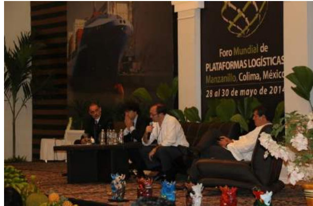
Panel: Director CEPAL, Ministro de España y Ministro de México