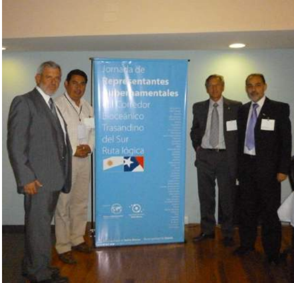
Fomentando vínculos con autoridades de Gobierno Por Corredor Binacional de cargas. Directores OMPL y Representantes del Corredor Bioceánico