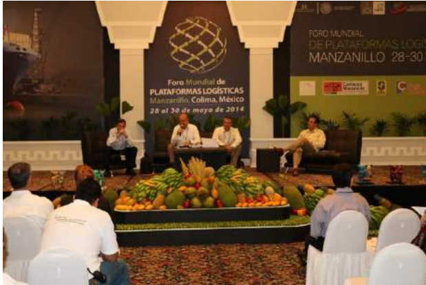
Panel de Logístico