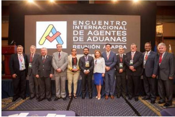
Autoridades ASAPRA, FEDA y panelistas