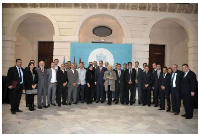
Autoridades de Cádiz e Internacionales