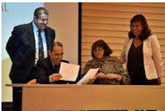
Bogotá Cámara de Comercio