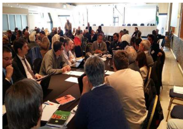
Comité Binacional de Integración, Argentina Chile. Comisión de Infraestructura y transportes