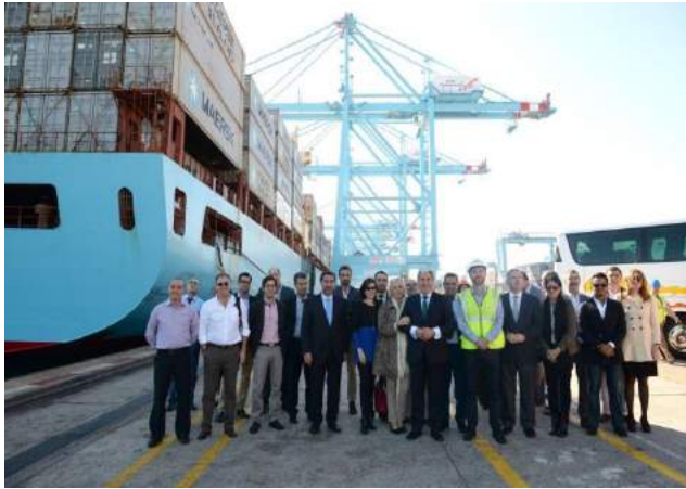
Visita a una de las plataformas de excelencia en España