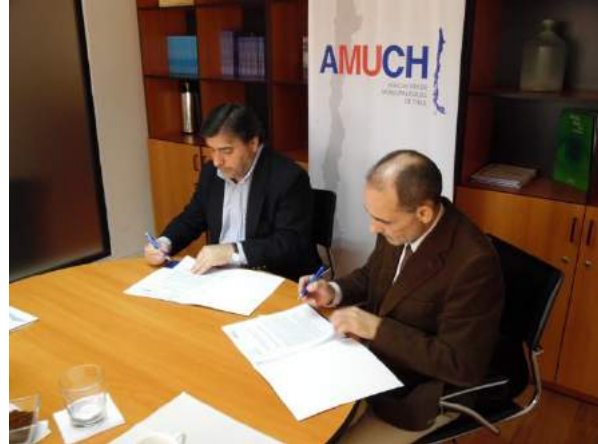
Asociación de Municipalidades de Chile