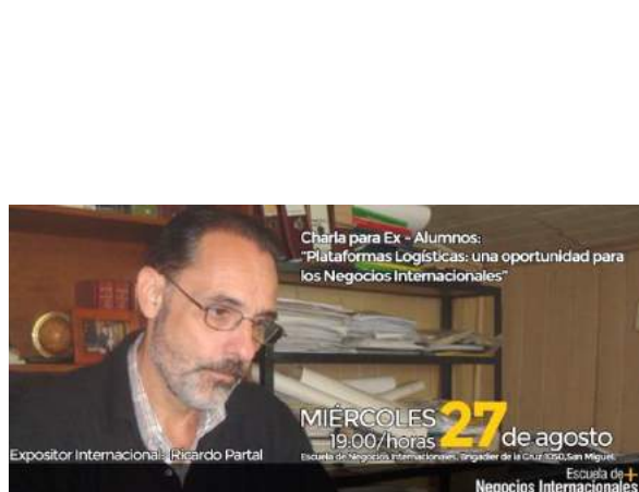
Disertación Universidad de Valparaíso, Chile