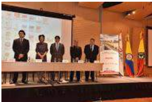
Autoridades Cámara de Comercio Y de OMCP