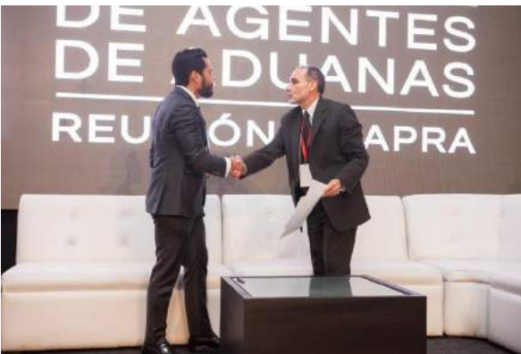
Federación Ecuatoriana de Despachantes Aduanales