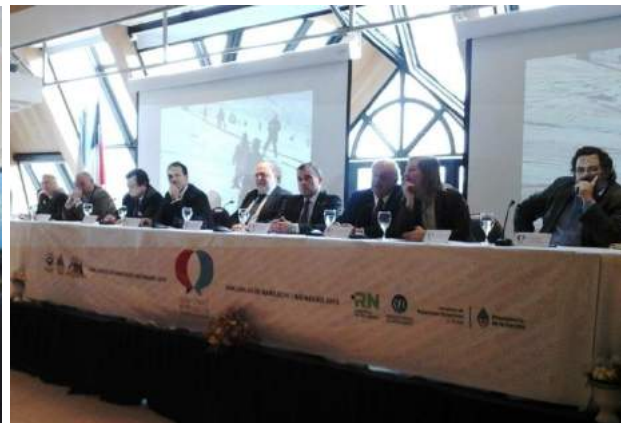
Comité Binacional de Integración, Argentina