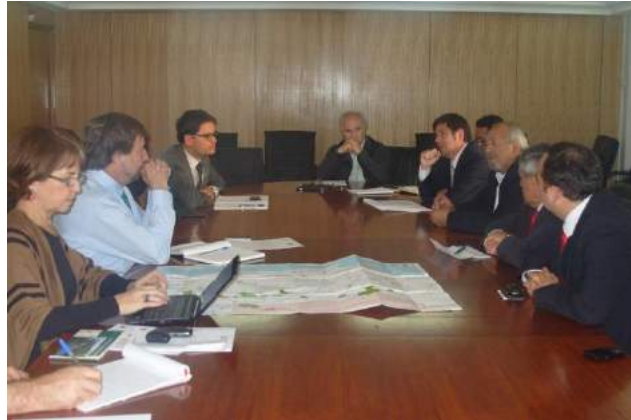
Trabajo conjunto con el Gobierno de Chile Ministerio de Transportes