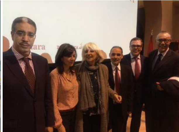
Ministro de Marruecos; Embajadora de Panamá, Alcaldesa de Cádiz; Presidente OMCL; Ministro de España; Embajador de España en Marruecos