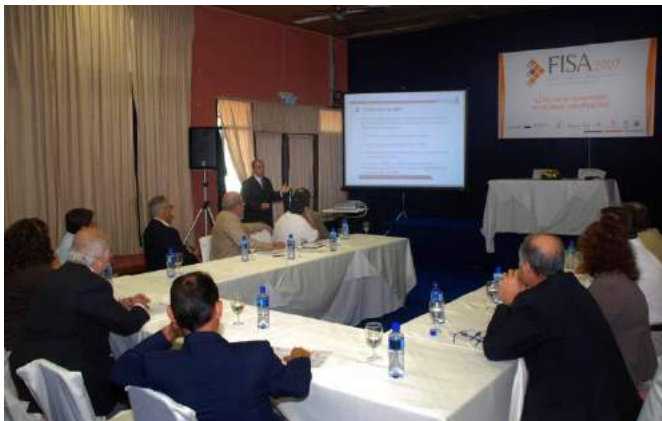
Presentación social, investigación (Consul. Análisis) ante Alcaldes y Directores de Universidades, por el beneficio que significa contar con estudiantes de la región Sur de la provincia de Buenos Aires estudiando en las Universidades de la ciudad de Bahía Blanca. (Argentina).