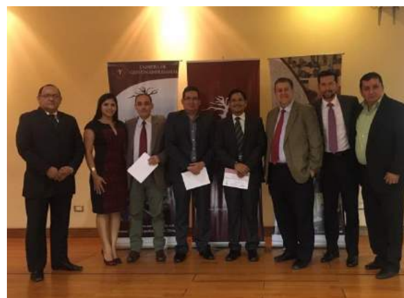
Disertación Magistral de Directores OM CPL en la Universidad de San Gregorio, Ecuador.