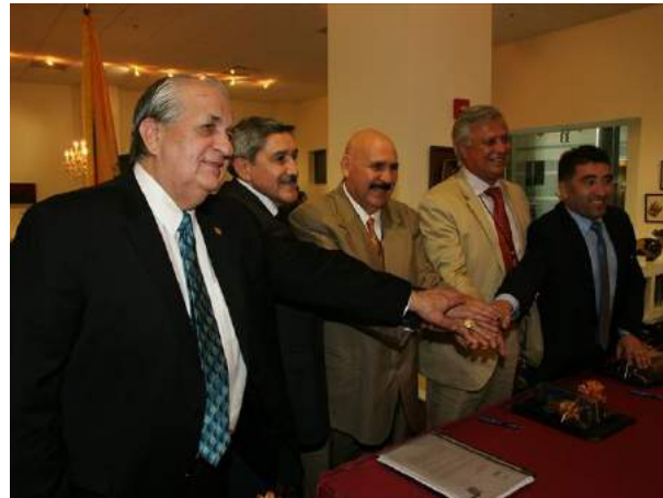
Alcaldes de Chile, España, Honduras, Texas; En la firma de Acuerdos de Integración