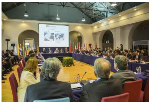
Apertura del evento