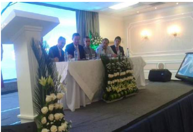
Cantón de Portoviejo, Ecuador